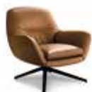
4 JENSEN FAUTEUIL CM 81X85 H78