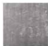
10 DIBBETS TAPIS CM 250X250